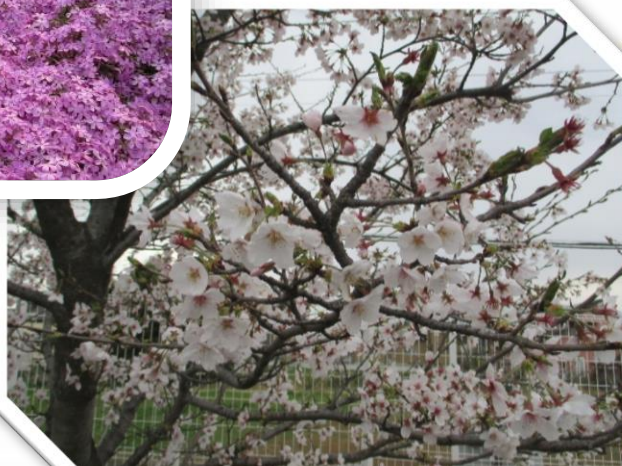
ベルジ南渋川の 桜