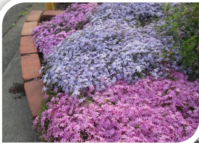
ベルジ渋川の 芝桜