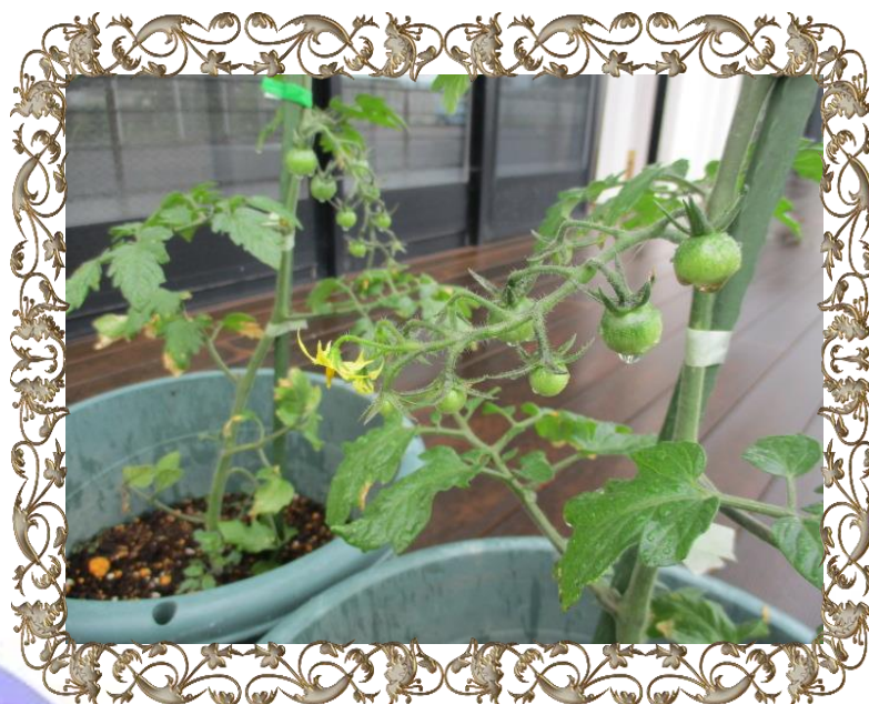
ご入居者様皆様に育てているミニトマトです

住宅型有料老人ホーム ベルジ渋谷 グランドホームベルジ南渋谷 グランドホーム渋谷