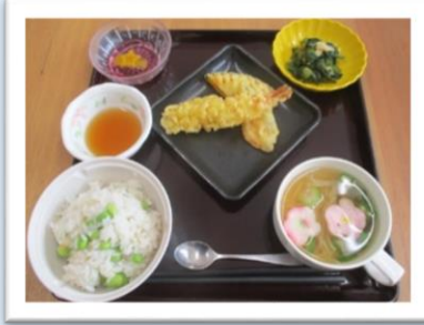
七夕メニュー☆七夕スープ・七夕ゼリー