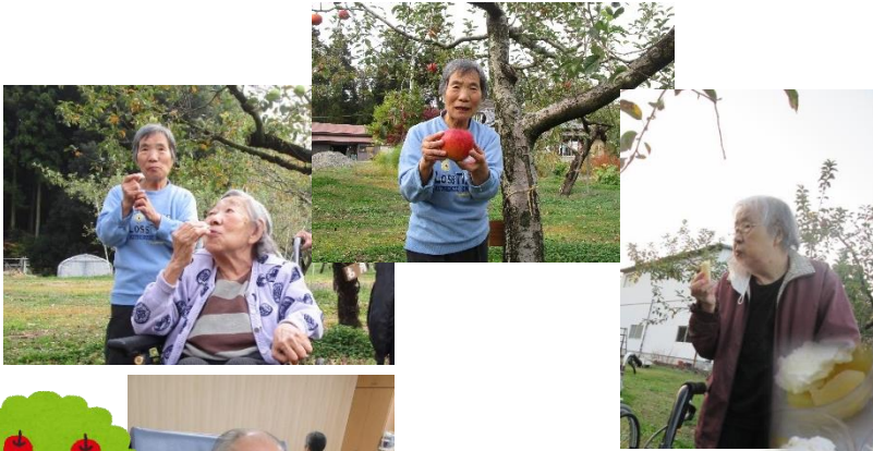
リンゴ狩り（峰岸果樹園様） に行ってきました。 『歯ごたえがいいよね』 と喜んでいただきました。