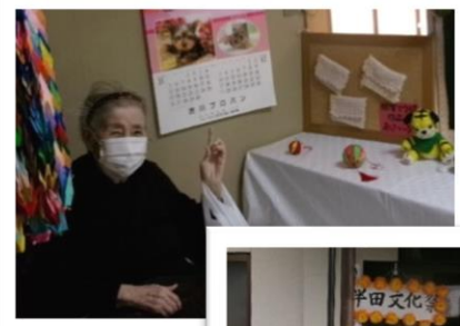
自治会主催の文化祭 にご入居者様の作品 を出展しました