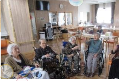
日常 施設の近くへ散歩に出かけたり シャボン玉を楽しんでいただき ました。