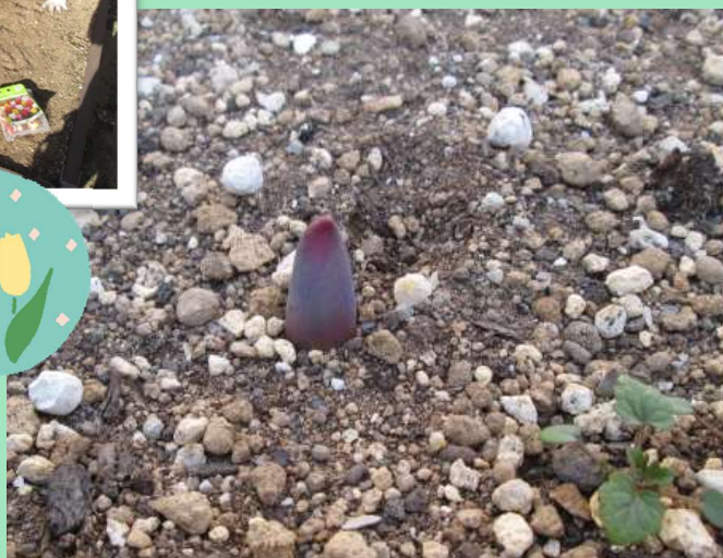
12月に植えたチューリップの芽が出てきました

住宅型有料老人ホーム ベルジ茨川 グランドホームベルジ南茨川 グランドホーム茨川