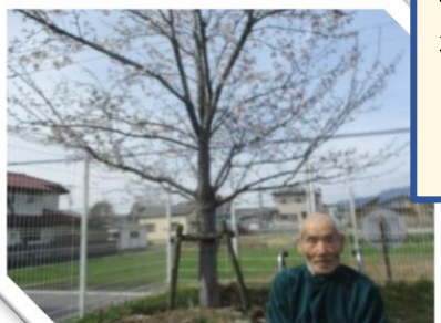
天気の良い日に、施設敷地内にて外気浴をしていただき、季節の花を楽しんでいただきました