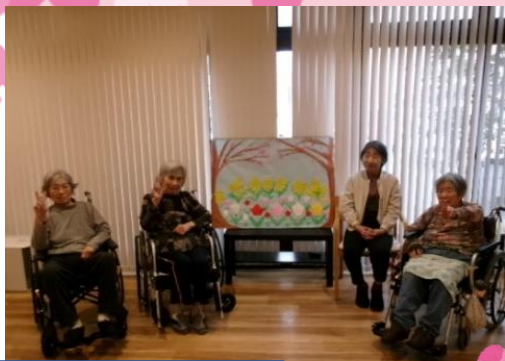
折り紙で作成した花を飾り、ご入居者様に春の季節を感じていただきました